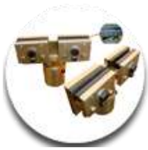
Зажим за отбортовку порогов 4шт.