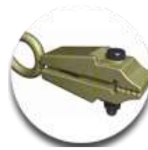
Зажим для вытягивания 2шт.