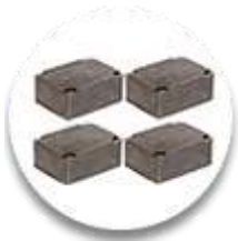
Резиновые проставки для стенов серии AS