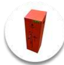
Электро-гидравлическая насосная станция