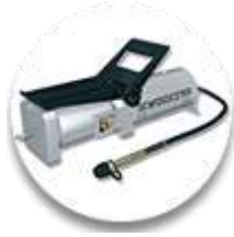
Пневмогидравлический насос 2шт