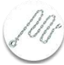
Тяговая цепь с крюком и захватом 2шт.