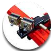
Универсальная клиновья система крепления