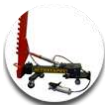
Силовое устройство усилие 10 т.