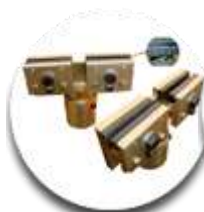
Зажимы за отбортовку у порогов