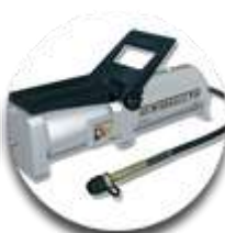
Пневмогидравл ический насос