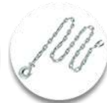
Высокопрочная цепь с тяговым крюком