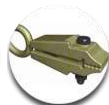
Зажим для вытягив ания