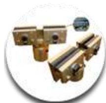
Зажимы за отбортовку порогов (усиленные)