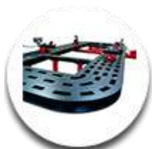
Платформа усиленная листовая