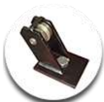
Ролик для тяги вниз