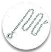
Тяговая цепь 2 шт.