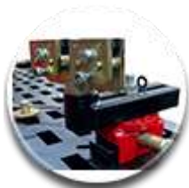
Опорно-поворотная система 4шт.