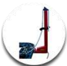
Силовая башня 2шт.