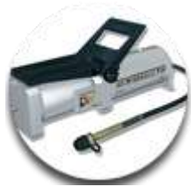
Пнеumoгидравлический насос 2шт