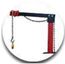
Устройство для тяги вверх