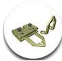
Зажим-скоба с дополнительной точкой фиксации