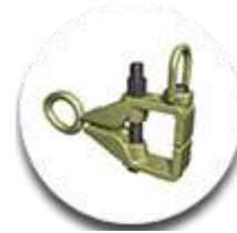
Квадратный зажим с дополнительной точкой