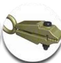
Зажим для вытягива ния