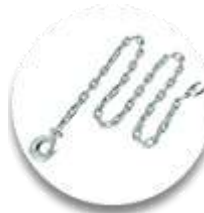
Высокопрочн ая цепь с тяговым крюком