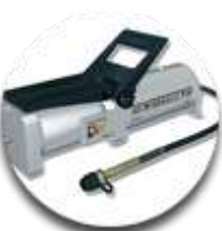
Пневмогидравл ический насос