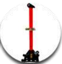
Силовая башня тяговое усилие 10т. с возможностью увеличения высоты